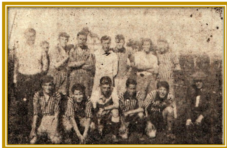
Equipo de quinta división campeón invicto 1934

En 1934 el Equipo de 5ta. división se consagró campeón invicto en el torneo organizado por la Liga de Football de General Sarmiento. Jugó 16 partidos, ganando 15 y empatando 1.