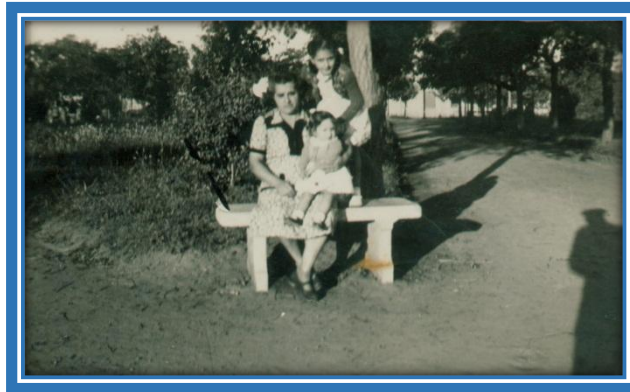
Plaza de Mayo en la década de 1950

y junto a ellos el saber y la serenidad de los mayores, el fuego arrebatador de la juventud, personificado en las figuras aureoladas del bello simbolismo de la edad temprana de French y Berutti, perladas sus sienes por las gotas refrescantes de una mañana lluviosa, repartiendo entre el pueblo los distintivos que usaron los patricios durante las invasiones inglesas, el blanco y el celeste, precursores de nuestra gloriosa e inmaculada bandera ¡jamás atada al carro triunfal de ningún vencedor de la tierra!”.