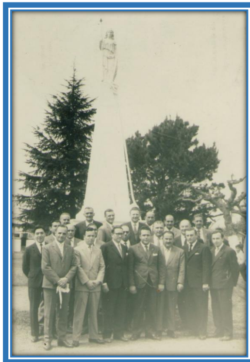
Subcomisión del Sesquicentenario posando delante de la Pirámide de Mayo inaugurada

Terminado el discurso, se procedió a la bendición de la réplica de la Pirámide Mayo y a la consagración del nuevo nombre de la plaza, que a partir de este día pasó a llamarse “Plaza de Mayo” .