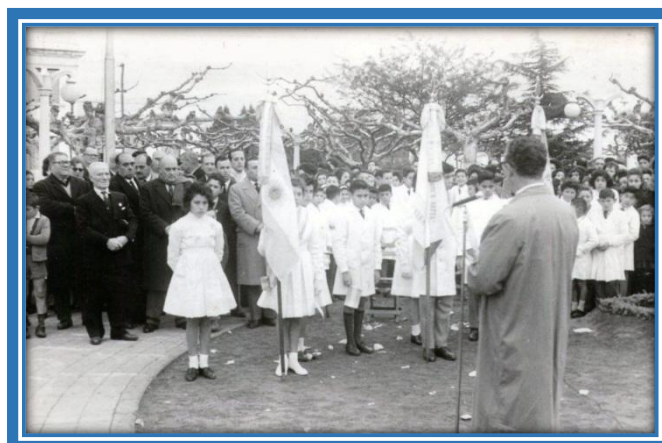
Palabras del Presidente de la Subcomisión en la Plaza Belgrano