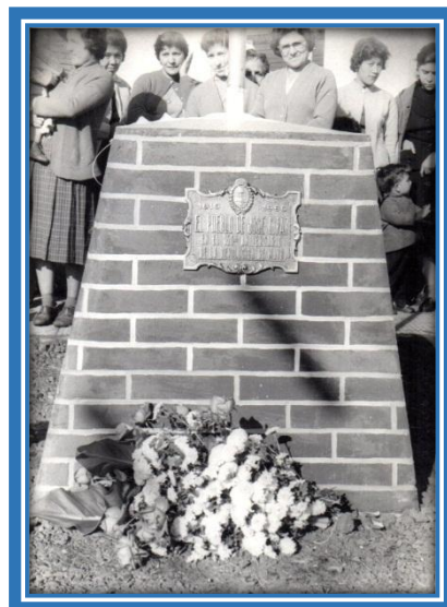
Placa colocada en un mástil

Con posterioridad, en José C. Paz se fueron realizando actos conmemorativos descubriendo la placa del Sesquicentenario en distintos lugares de la localidad, como la Estación del Ferrocarril, los Clubes Altube, El Porvenir, Helvecia, Italiano y Defensores, la Parroquia San José, entre otros.