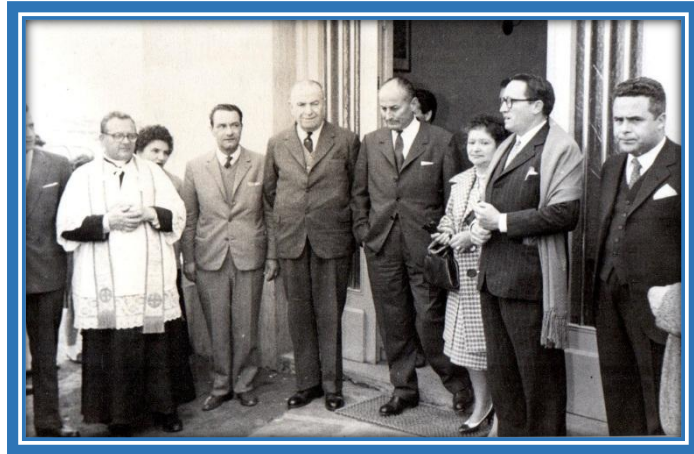
Placa en el Club Italiano