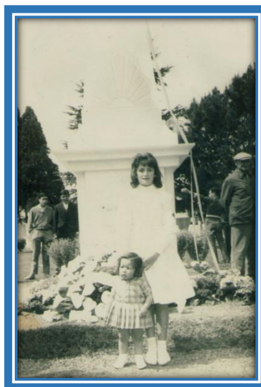
Alumna de la Escuela Nº 4 (EP Nº 1) en el día de la inauguración