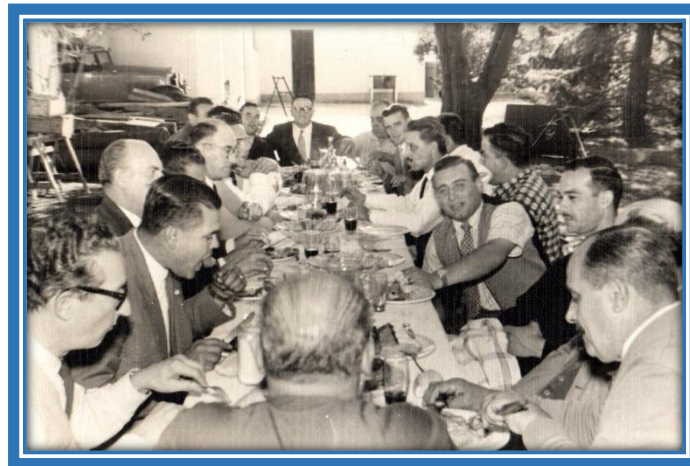
La Comisión local del Sesquicentenario finalizó su actividad compartiendo un buen asado