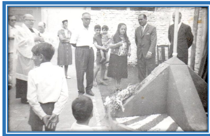
Placa en Helvecia Foot-ball Club

Inmediatamente se comenzó la construcción de la réplica de la Pirámide en la Plaza Centenario, y al promediar septiembre la obra estaba llegando a su fin, por tal motivo se dispuso inaugurarla el día 2 de octubre de 1960.