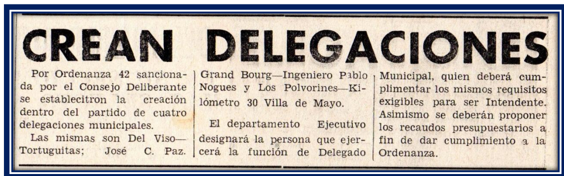
Periódico Avance N° 78

El periódico informa que “ el Ejecutivo designará la persona que ejercerá la función de Delegado Municipal, quién deberá cumplir los mismos requisitos exigibles para ser Intendente. Asimismo se deberán proponer los recaudos presupuestarios a fin de dar cumplimiento a la ordenanza ”.