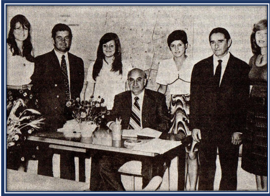
Personal de la Delegación Municipal de José C. Paz