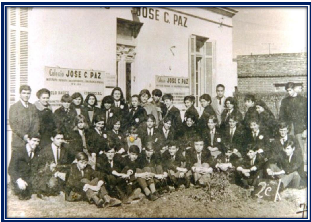
Instituto “José C. Paz” – alumnos del nivel secundario