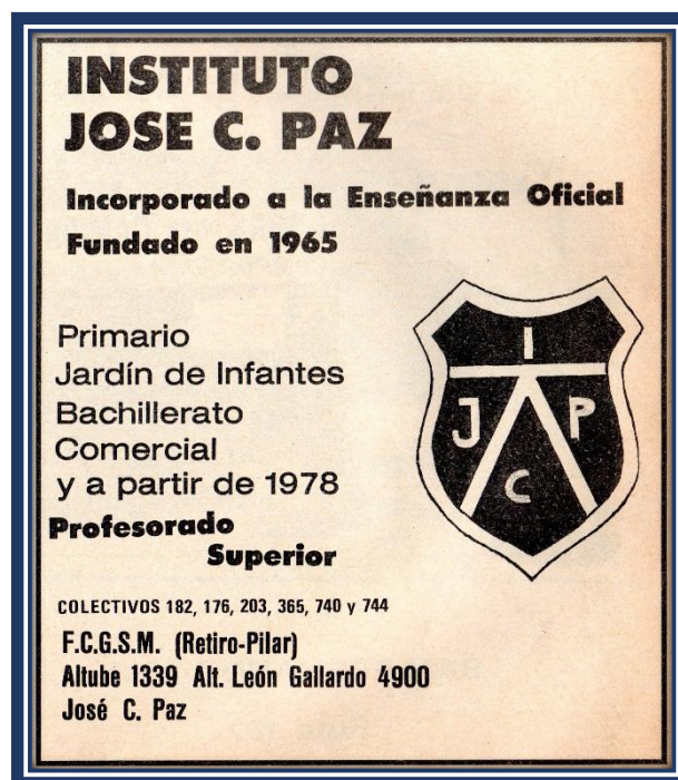
Propaganda del Instituto José C. Paz, Periódico “Sucesos” Nº 17 de noviembre/diciembre de 1977

Agrega el periódico citado: “El auspicioso acontecimiento viene a llenar un notorio vacío. Efectivamente, la localidad y aún el partido de General Sarmiento carecen en la actualidad de posibilidades de estudios superiores, no sólo para la cada vez más numerosa población estudiantil de nivel medio que tiene, sino también para la prosecución de la carrera docente de los muchos maestros primarios que realizan sus actividades en la zona”.