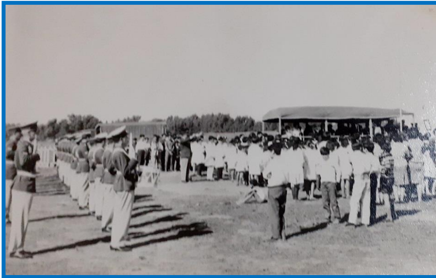
Vista del acto de imposición del nombre