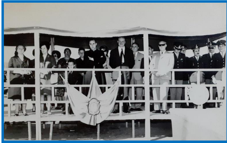
Vista de las autoridades en el palco

Tussanotte la izaba, ejecutada por la Banda de la Escuela de Suboficiales Sargento Cabral..