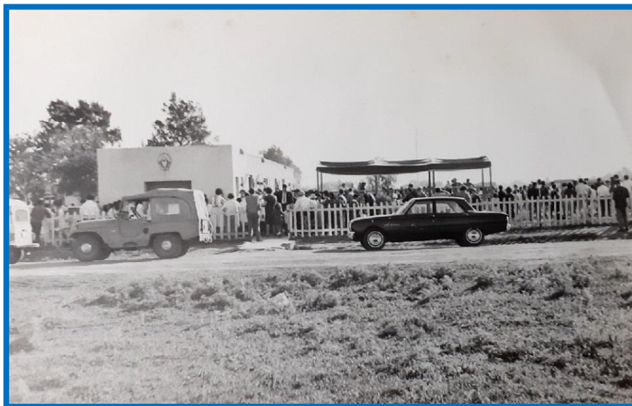
Exterior del establecimiento

¿Quién fue Belisario Roldán? Presentamos su biografía publicada por Página 12 en “Diccionario de los Argentinos. Hombres y Mujeres del Siglo XX” , pág. 636: