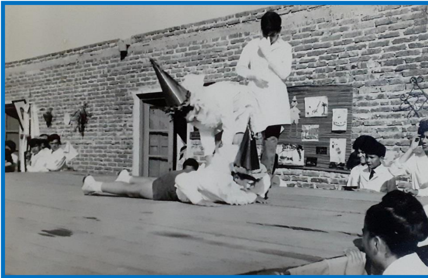
Números artísticos interpretados por los alumnos de la Escuela N a 50