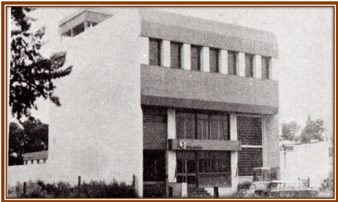
Edificio de la Central Telefónica de José C. Paz

El periódico “Avance” 1 bajo el título “Habilitan la Nueva Central Telefónica en José C. Paz” , introduce al artículo publicado expresando “Con un acto de suma trascendencia, tuvo efecto el 31 de octubre ppdo, la habilitación de la nueva central telefónica automática de la ciudad de José C. Paz, con sistemas de servicio medido y telediscado. Cumpliósse así una de las grandes ambiciones de la población de contar con un moderno y eficaz medio de comunicación, cuyas ventajas y beneficios resultaría obvio enumerar” .