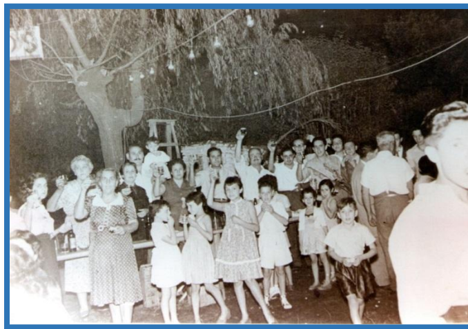
Baile en la década del setenta

Finalizaba el artículo expresando “Nos causó muy grata impresión el clima de confraternidad que imperó en todo momento, como también el adelanto notable de las obras que se están desarrollando” 3 .