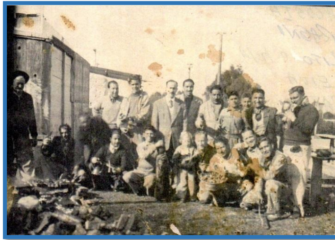
Asociados trabajando en las instalaciones del Club

Cuenta la institución con una amplia sede social propia ubicada en la calle Gelly y Obes y Arias; su actual C. D. está abocada a la terminación de la cancha de bochas la que será orgullo para la institución, ya que por su diseño puede considerarse como única en la zona” 1 .