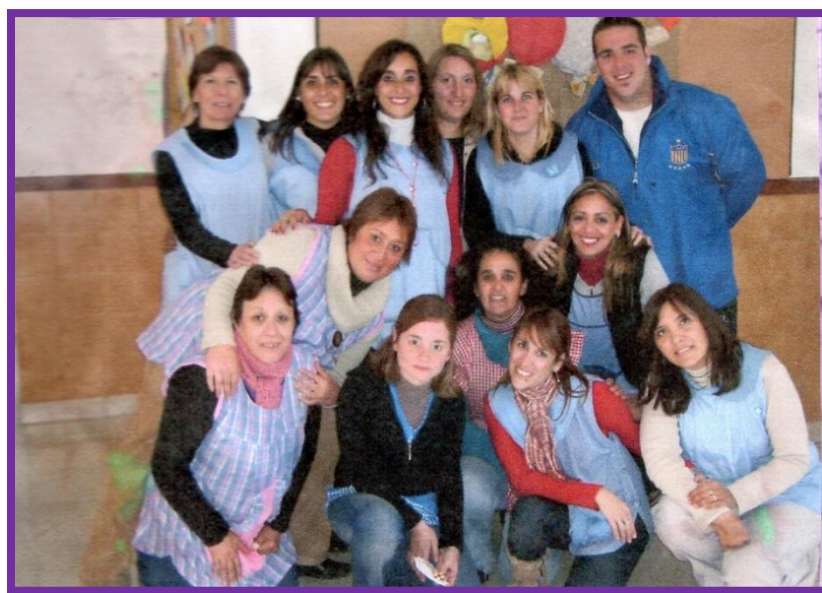
2008: Personal del Jardín de Infantes N° 909