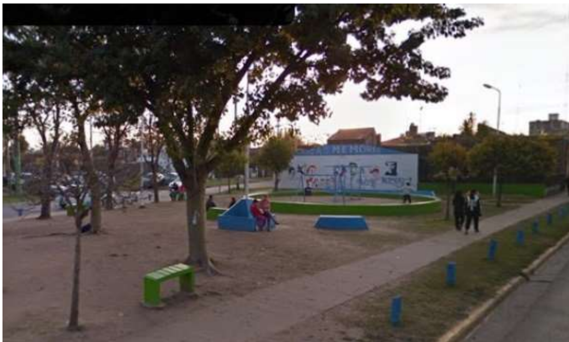
Fotografía: Plaza de la Memoria de José C. Paz en Av. Gaspar Campos y Cabo Benítez de Villa Altube.