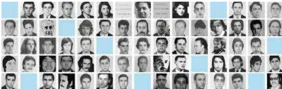
Fotografía: detenidos-desaparecidos de la Facultad de Ingeniería – UBA