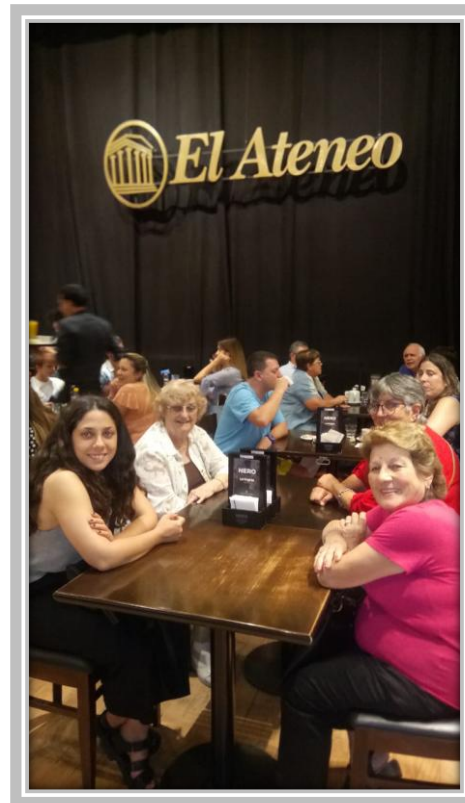
Un momento para el café

Los participantes de la visita pudieron contemplar la belleza colonial de la Iglesia del Pilar y tener un momento de oración. En el Ateneo pudieron ver el esplendor del Teatro Grand Splendid, convertido hoy en librería, donde más de uno de los visitantes pudo elegir en los vastos anaqueles temáticos un libro para llevar. Por supuesto, no faltó el espacio para el café o una bebida fresca en la tarde calurosa.